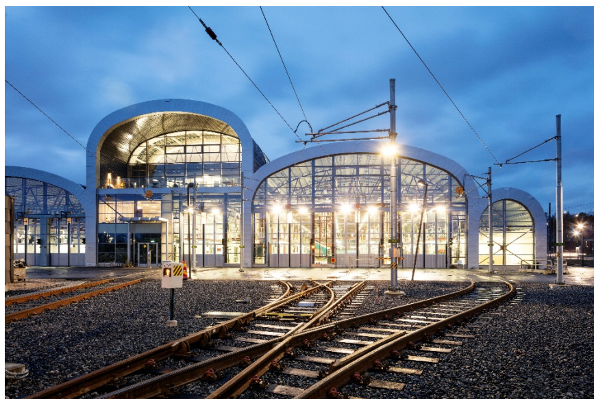
Agadepån, nominerad till Trafikverkets arkitekturpris 2019. Arkitekt: &Rundquist och BBH Arkitektur & Teknik.

En region arbetar både direkt och indirekt med att forma eller skapa förutsättningar för en god livsmiljö för invånarna. Genom att medvetet arbeta med den gestaltade livsmiljön kan en region skapa stora värden, både materiella och immateriella. Perspektiv som människan i centrum, plats och identitet, regional tillväxt samt samhällsutmaningar ger en bild av vad gestaltad livsmiljö – arkitektur, form, design, stadsbyggnad, konst och kulturarv – kan göra för att stärka den regionala utvecklingen. Men vilka verktyg har då politiker och tjänstepersoner inom det regionala utvecklingsarbetet för att jobba med dessa värden? Dessa lyfts i nästa kapitel.