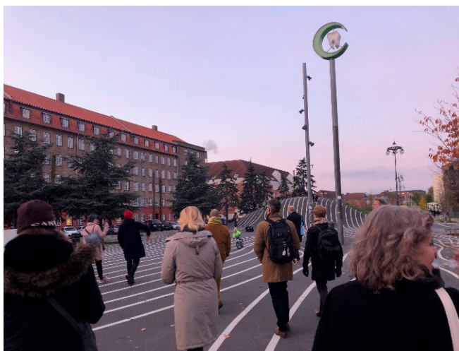
Nätverket NOKS gör studiebesök på Superkilen i Köpenhamn.

Varför intressant: En region kan med finansiella medel stötta samverkan som stimulerar till erfarenhetsutbyte och utvecklat arbete med konst i offentliga miljöer runt om i regionen.