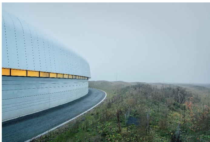
Max IV fick år 2016 Skånes arkitekturpris. Arkitekter: Fojab arkitekter och Snøhetta. Byggherre: Fastighets AB ML4.

Varför intressant: Genom att uppmärksamma de goda projekt som genomförs i regionen får vinnarna en bekräftelse på sitt arbete och chans till ökad publicitet, vilket är viktigt för att kunna utvecklas. Att uppmärksamma goda projekt och vad dessa medför ger också en möjlighet för regionen att inspirera beställare att se vikten av god arkitektur och design.