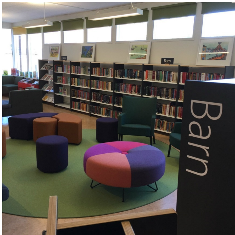
Barnhörnan i Örsundsbro bibliotek som också har meröppet.