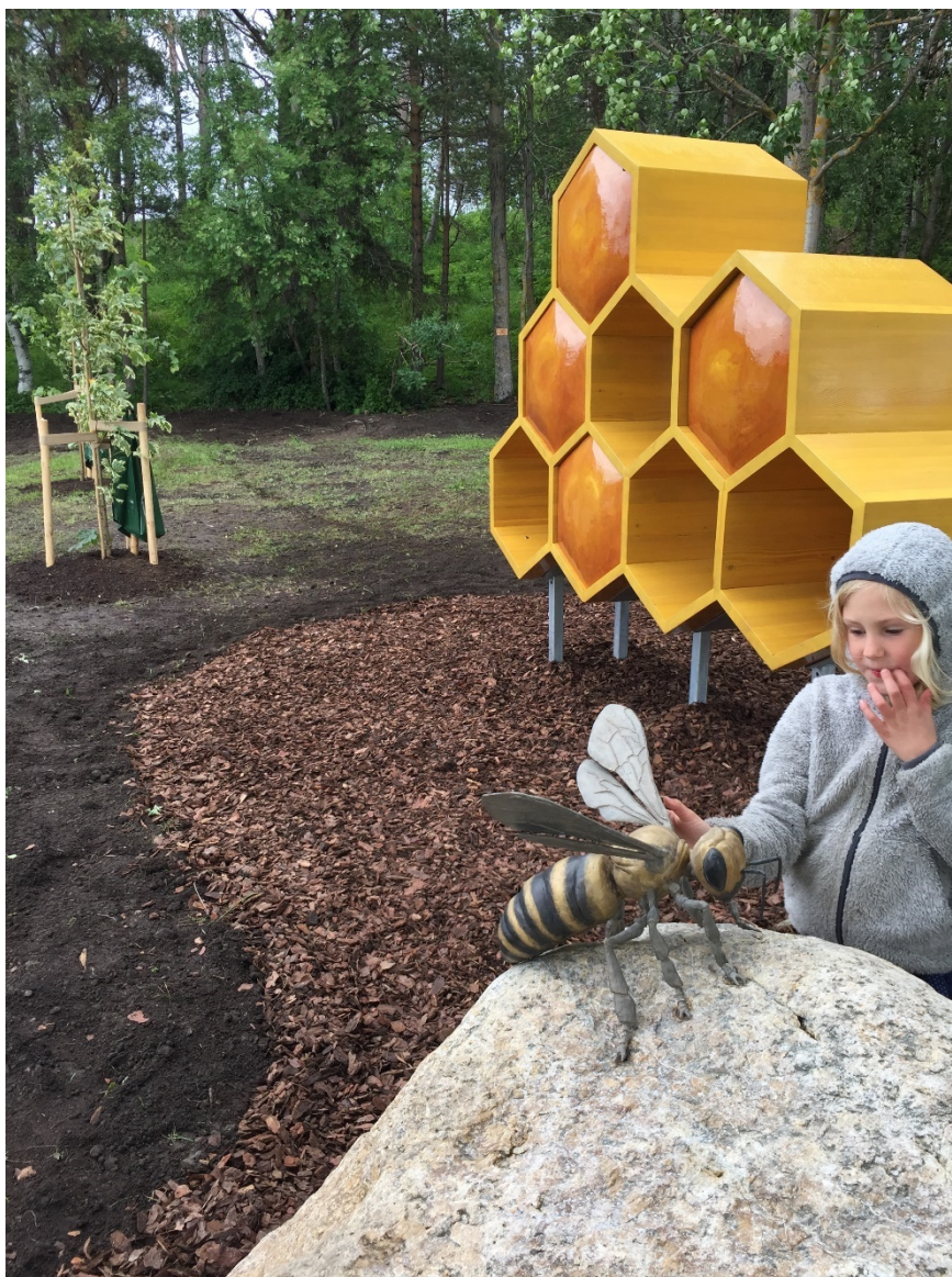
Offentlig Gestaltning vid Orrvikens Skola i Östersunds Kommun. Titel Bisamhället, år 2019. Konstnär och fotograf: Christina Langert.