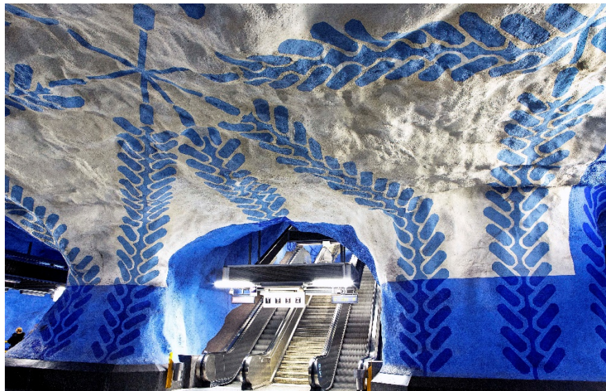
Konst i tunnelbanan vid T-Centralen av konstnären Per Olof Ultvedt.

Den byggda miljön styr vårt vardagsliv genom hur och om vi kan röra oss mellan olika miljöer och hur vi kan använda oss av dessa miljöer. Men arkitekturen påverkar oss också mer subtilt genom hur den formar samtidens attityder och livsstilsval. En stadsplanering som exempelvis fokuserar på den promenad- och cykelvänliga stadsstrukturen medför att fler människor väljer att ta sig fram till fot eller med cykel vilket även har visat sig leda till generellt sett mer fysiskt aktiva invånare. Arkitektur berör alla varje dag och bidrar direkt till hur vi mår och trivs samt hur människor och samhället fungerar. Forskning visar till exempel att god design kan höja resultatet i skolor och få sjukhuspatienter att tillfriskna fortare 4 . Bemödar vi oss att skapa god kvalitet, arbetar långsiktigt och med omsorg och eftertanke kan vi med arkitektur medverka till en förbättrad livsmiljö, både för den enskilde och för samhället i stort, genom att skapa bestående värden. Arkitekturen har stor betydelse för levande och trygga livsmiljöer och kan bidra till att motverka utanförskap, ohälsa och minskat samhällsengagemang. Därmed är arkitektur också en viktig demokratifråga.