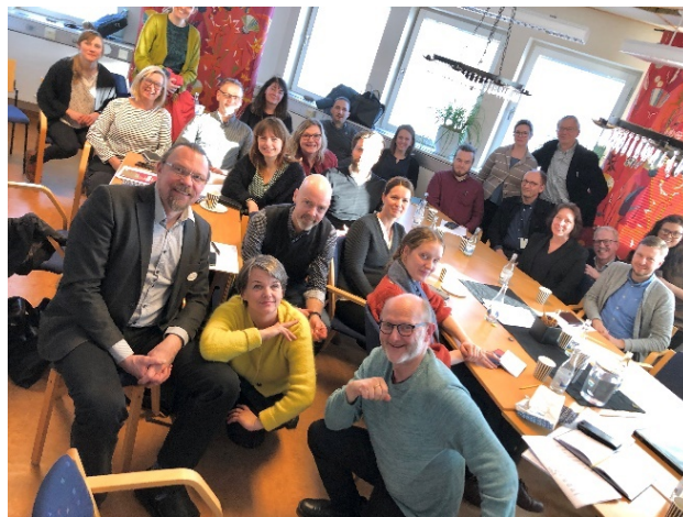
Arkitekturrådet Dalarna.

Varför intressant: Att samla olika regionala och lokala aktörer för att dela med sig av kunskap, erfarenheter och svårigheter, hjälper till att sätta fokus på vikten av att arbeta medvetet med den gestaltade livsmiljön, från överordnad planering till faktiska projekt. Det fungerar också som ett stöd för resurssvaga aktörer att kunna hitta samverkansformer och nya arbetsmetoder. Nätverket har funnits under lång tid med varierande intensitet och det kan därför vara intressant att ta del av hur inriktning, metoder och teman växlat under åren och hur de arbetat för att hålla sig aktuella. Nätverket har funnits sedan 1998.