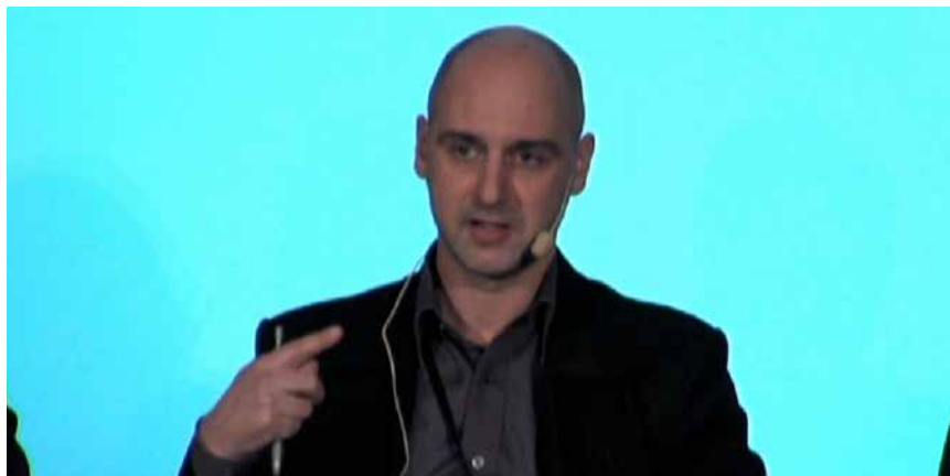
Calle Nathanson