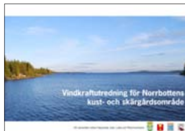
Omslag till en gemensam vindkraftstudering för kustkommunerna Kalix, Haparanda, Piteå och Luleå i Norrbotten.