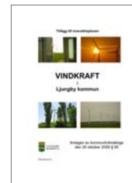
Tillägg till översiktsplanen för Ljungby kommun om planering för vindkraft. Planen antogs av kommunfullmäktige den 20 oktober 2009 § 95.

- Vi var sex tjänstemän och två politiker på varje möte. Det var väl använda resurser eftersom vi fick tillfälle att möta ortsborna och svara på frågor, avslutar Ulla Gunnarsson.