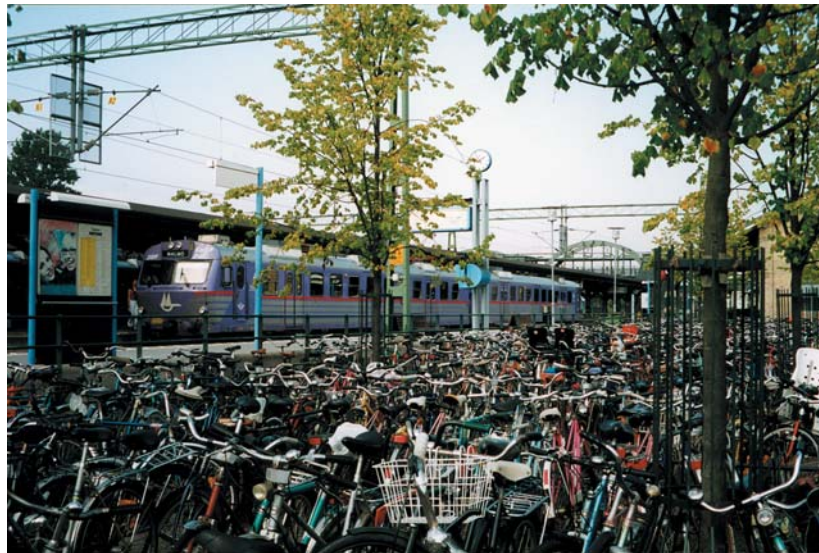
De regionala Pågatågen är ett hållbart och miljövänligt transportsystem i tätbefolkade och pendlingsbenägna Skåne.

Eftersom Region Skåne har en tät dialog med berörda aktörer, däribland kommunerna, är det naturligt att formuleringarna närmar varandra.