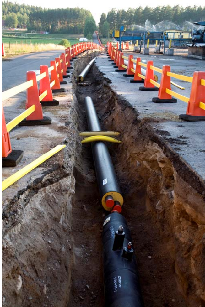
Kommunerna i stockholmsregionen nämner ofta i sina översiktsplaner utbyggnad av fjärrvärme som ett mellankommunalt samarbetsprojekt.

Dessa skrivningar förefaller vara ett beaktande av översiktsplanerna i det regionala utvecklingsprogrammet men de är säkert också helt eller delvis en effekt av långvarig dialog mellan kommunerna och Stockholms läns landsting om dessa frågor.