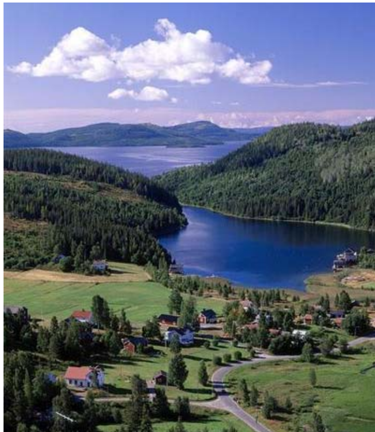
Världsarvsområdet Höga Kusten är ett bra exempel på kommunalt samarbete. Örnsköldsvik samarbetar med Kramfors och Länsstyrelsen för Västernorrland.

Ett exempel på en mer konkret överensstämmelse i mer avgränsade frågeställningar är att det bedrivs mellankommunalt samarbete inom besöksnäringen. Programmet framhäver till exempel att ”besöksnäringen är en näring i länet som har goda förutsättningar att utvecklas till ett kluster” och att ”länets rika natur- och kulturmiljö och världsarvet Höga kusten är viktiga resurser”. I dokumentet skrivs det även om en gemensam turismstrategi för länet som skulle kunna vara ett värdefullt stöd i utvecklingsarbetet. Örnsköldsviks kommun behandlar Höga kusten i sin översiktsplan med formuleringen ”kommunen samarbetar med Kramfors och länsstyrelsen m.fl. om världsarvsområdet Höga kusten”.