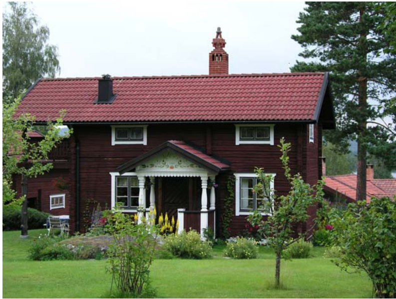
Kommunerna i Dalarna som till exempel Smedjebacken slår vakt om att all nybyggnation utförs på ett ekologiskt riktigt sätt och att man följer lokal tradition.