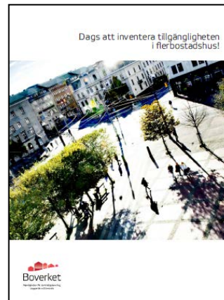
Kortare information om inventeringen