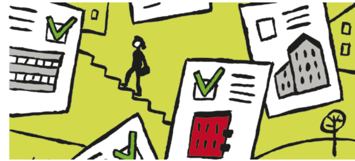
Illustration: Jan Olsson

Tid: 1 februari 2014 fram till den 1 augusti 2015