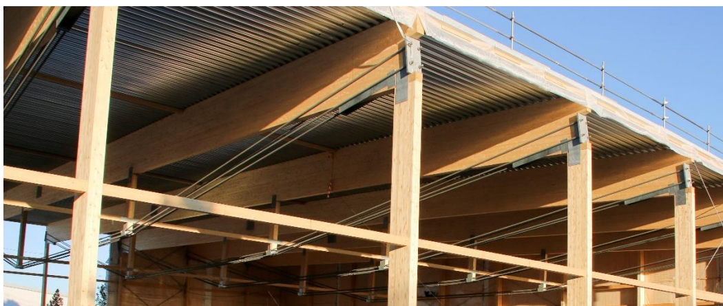
Figur 2. Takstolarnas typkonstruktion.

Tarfalahallen var 96 meter lång och 55 meter bred. Taket bars upp av takstolar bestående av 14 underspända limträbalkar med en spännvidd på 54,5 meter och med dragband och två trycksträvor som stöd under varje limträbalk. Limträbalkarna var upplagda på limträpelare vid ytterväggarna. Trapetsprofilerad plåt med bärriktning vinkelrätt mot takstolarna var monterad direkt mot balkarnas ovansida. Stabilisering för horisontella laster (i huvudsak vindlast) förutsattes ske genom skivverkan i takplåten samt genom vindkryss i gavlarna och i de längsgående väggarna. Trycksträvorna var sammankopplade mellan takstolarna och byggnadens gavlar med horisontella limträbommar.