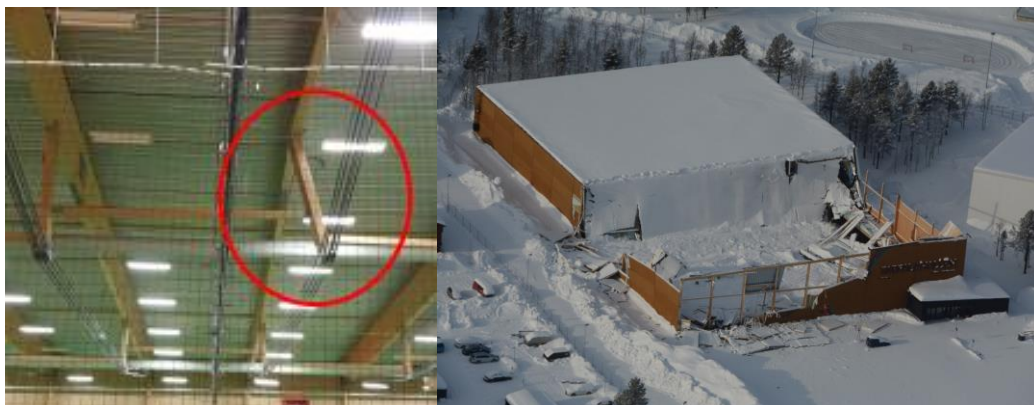
Figur 1. Till vänster en bild tagen strax före raset. Notera den markerade snedställda trycksträvan. Till höger Tarfalahallen två dagar efter raset.