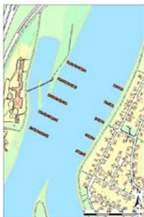
Ledväggar i Klarälven. Illustration: Karlstads kommun

Karlstad har genom sin placering mitt i ett delta ett geografiskt mycket utsatt läge. Staden riskerar att översvämmas av både Klarälven och Vänern. Som ett led i arbetet med att stävja vattenflödet i Klarälven har kommunen deltagit i två Interregprojekt 5 . Karlstads kommun kommer under innevarande programperiod att gå vidare med de studier som påbörjades under föregående period kring hur fenor, eller ledväggar, kan minska sedimentationen och därmed översvämningens risk för Klarälven. Syftet med ledväggarna är att koncentrera vattenflödet i mitten av älven för att på så sätt minska mängden sediment längre ner mot Vänern. I projektet kommer man att utvärdera effekterna av sådana ledväggar, och förhoppningen är att man i ett senare skede kan bygga ledväggar vid Sandgrundsudden där Klarälven delar sig i två älvgränar (se bild). I nuläget planerar man för sammanlagt tio ledväggar som placeras i rader. De fem ledväggarna på den västra stranden beräknas sticka ut 65 meter medan ledväggarna på den östra stranden kan komma att sticka ut 45 meter.