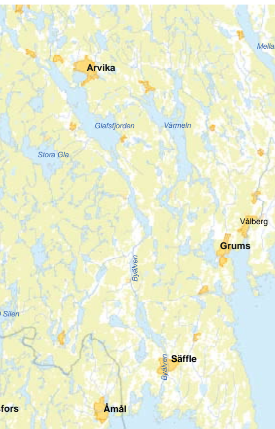
Området kring Byälven. Illustration: Arvika kommun

Inom ramen för Interreg Nordsjön bedrivs flera projekt med klimatfokus. Nedan kommer utvalda delar från tre nära sammanknutna projekt presenteras som samtliga studerar hur städer och samhällen runt Vänernområdet kan komma att påverkas av ett förändrat klimat 3 . I projekten analyseras både vilka behov av åtgärder som finns samt hur man praktiskt ska gå till väga för att minska riskerna för översvämningar, ras och skred. De stora regnmängder under hösten 2000 som gav höga flöden i Värmland och Dalsland och ledde till stora översvämningssproblem kring Vänern utgör en utgångspunkt för de berörda svenska kommunernas deltagande i Interregprojekten. Nedan redovisas först området kring Byälven vilket sedan följs av Klarälvens deltaområde. Sist, innan avsnittet om Östersjöprojekten behandlas Malmö stads arbete med att ta fram ett handlingsprogram samt konkreta fysiska åtgärder för klimatanpassning. Detta arbete stöds av två EU-finansierade projekt.